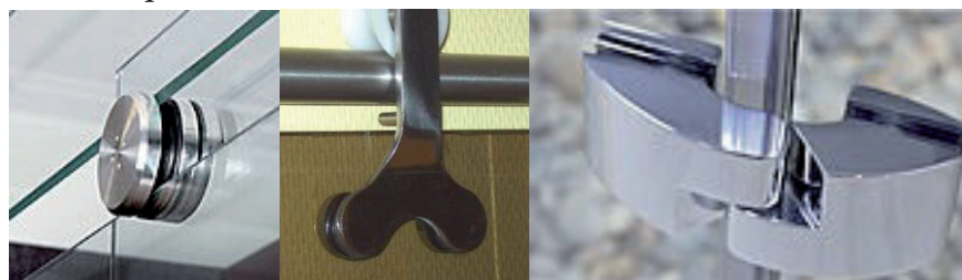
Coupes verre, Tournettes, Ventouses, Mèches (différents Ø), meules, colle UV+ Lampes