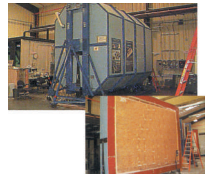
Tableau des données (Valeur R) du mur en entier.