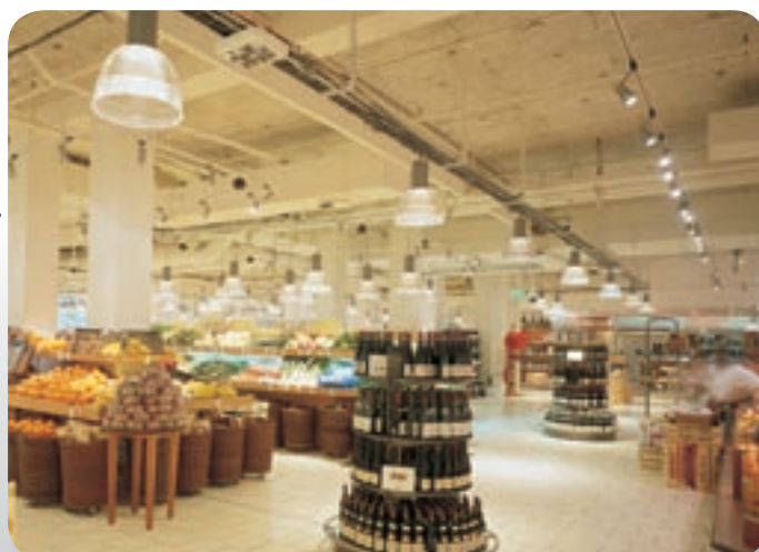
Le Bon Marché Epicerie