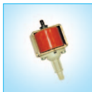
Pompe à condensats